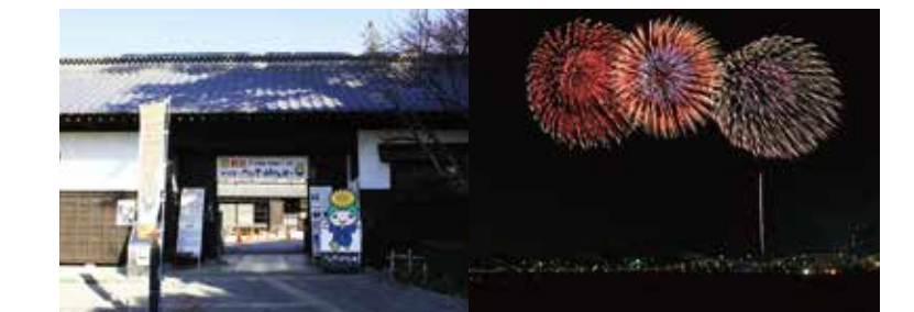
べに花ふるさと館